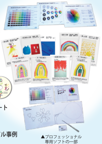
▲プロフェッショナル専用ソフトの一部