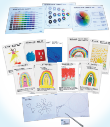
▲プロフェッショナル専用ソフトの一部